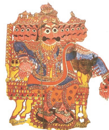
Φιγούρα του Ινδικού θεάτρου σκιών.

όπως η ζωγραφική, η χαρακτηριστική, η μουσική και η μιμική. Το ρεπερτόριο χαρακτηρίζεται από θεματική ευρύτητα όπως θρησκευτικά, λαϊκά, ιστορικά θέματα, κωμωδίες, θρύλοι και παραδοσιακά έπη. Η Κίνα, σε αντίθεση με την υπόλοιπη Ασία, στρέφεται σε καθημερινά θέματα ξεφεύγοντας από τον λατρευτικό τόνο που διατηρεί το θέατρο σκιών σε άλλες περιοχές. Μετά την Κίνα, μόνο η Μεσόγειος θα ξαναβρεί αυτό το κλίμα για να στραφεί, αποκλειστικά στο τέλος, στην κωμωδία.