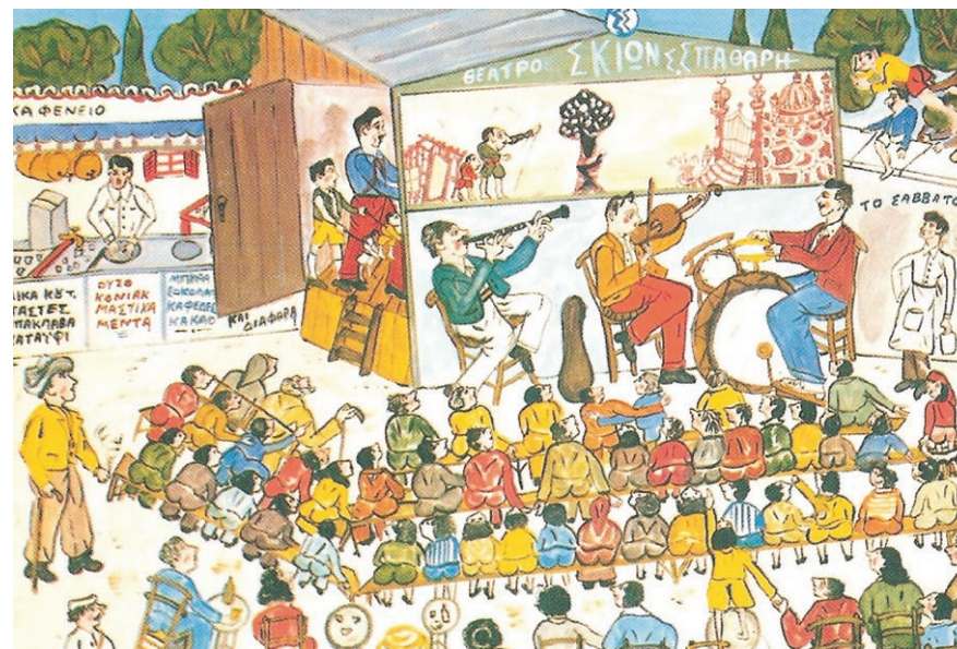
Θέατρο σκιών, ζωγραφική Ευγένιος Σπαθάρης

καντάδες, ευρωπαϊκά κ.α, κάτι που άρεσε ιδιαίτερα στους θεατές. Τους τραγουδιστές συνόδευε ένα μουσικό όργανο ή ολόκληρη ορχήστρα, όπως συχνά έκαναν ο Μόλλας και ο Χαρίδημος.