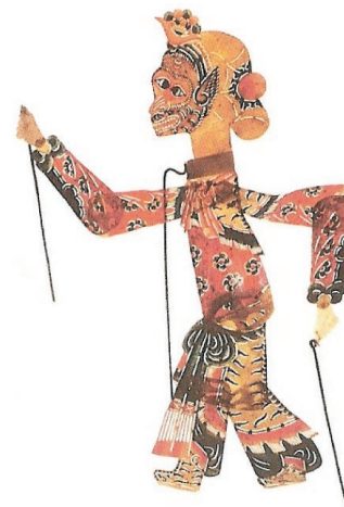
Φιγούρα από το κινέζικο θέατρο σκιών.