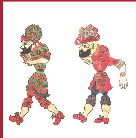
Τούρκικο θέατρο σκιών. Χατζηαβάνης - Καραγκιόζης.