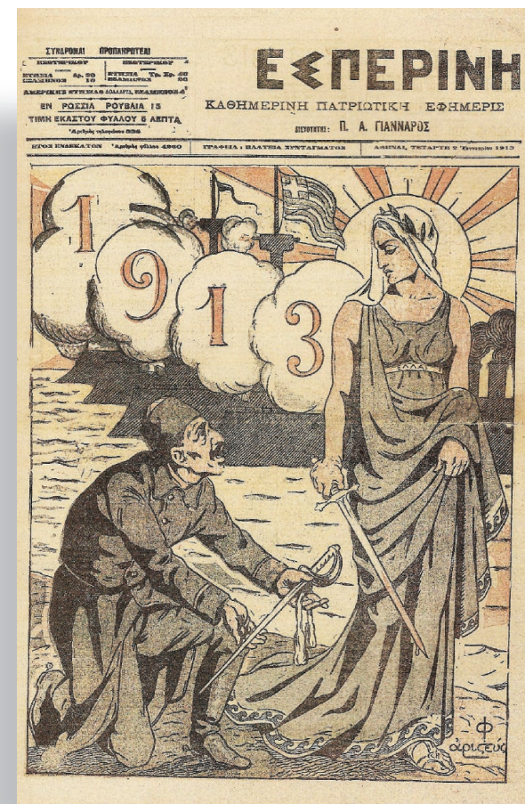
Από το βιβλίο: Η Αθήνα των Βαλκανικών πολέμων 1912 - 1913 (σελ. 83)

Η πορεία προς τον εκσυγχρονισμό του ελληνικού κράτους κατά την περίοδο 1833-1909 χαρακτηρίζεται από πολλαπλές δυσχέρειες. Κατά την περίοδο αυτή πραγματοποιήθηκε η Ένωση της Επτανήσου (1864), της Θεσσαλίας και της Άρτας (1881) και μέρους της Ηπείρου με την Ελλάδα. Παρ' όλη την εδαφική επέκταση και την αισιοδοξία που αυτή γέννησε, τα λαϊκά αιτήματα για την εδραίωση της δημοκρατίας σκοντάφτουν στη βίαιη αντίδραση δύο ξένων βασιλέων, του Όθωνα (1833-1862) και του Γεωργίου Α' (1863 -1913). Όταν από το 1881 η κυβέρνηση περνά στα χέρια του Χαρίλαου Τρικούπη, παρατηρείται μια συντονισμένη προσπάθεια για την εκβιομηχάνιση της χώρας, την ενίσχυση της οικονομίας, την εξυγίανση της δημόσιας ζωής, καθώς επίσης και τη δημιουργία αναπτυξιακών έργων κοινής ωφελείας. Όλα αυτά συνετέλεσαν στην ανάπτυξη του εμπορίου, της ναυτιλίας καθώς επίσης και στη μετατόπιση του πληθυσμού της υπαίθρου προς τα αστικά κέντρα με την ανάλογη δημογραφική ανάπτυξη. Η Επανάσταση στο Γουδί το 1909 θα καταλήξει στην ανάληψη της πρωθυπουργίας από τον Ελευθέριο Βενιζέλο, ο οποίος θα προσπαθήσει να εκσυγχρονίσει το κράτος και να δημιουργήσει