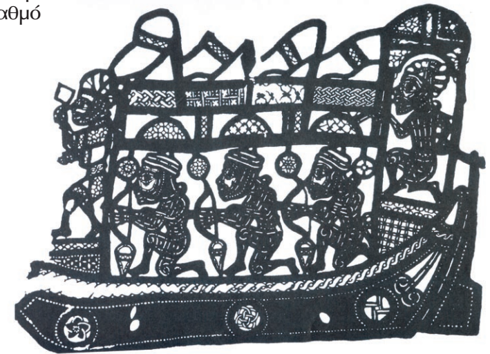
Φιγούρες από Αιγυπτιακό θέατρο σκιών.

*Το βυζαντινό μιμικό θέατρο σημάδεψε τον μεσαίωνα και επηρέασε τη λαϊκή λογοτεχνία. Τα πτωχοπροδρομικά για παράδειγμα, ποιήματα του 12ου αιώνα, έχουν το ίδιο κλίμα του μιμικού θεάτρου. Ο πρωταγωνιστής τους, πειναλέος και πολυτεχνίτης, εμπλούτισε θεματολογικά τις λαϊκές δημιουργίες της εποχής και ίσως το οθωμανικό θέατρο σκιών. Έτσι εξηγούνται τα κοινά στοιχεία που παρατηρούνται σε φαινομενικά άσχετα χρονικά και ιστορικά θεατρικά είδη: η δυσμορφία των πρωταγωνιστών, οι ακατάπαυστοι ξυλοδαρμοί, οι σταθεροί τύποι πάνω στη σκηνή, οι απλοϊκές υποθέσεις, οι ερωτικοί αστεϊσμοί μέχρι υπερβολής, η παραποίηση της γλώσσας, οι παρεξηγήσεις κ.λ.π.