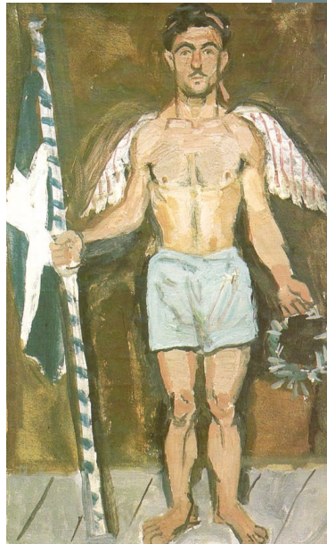
Τσαρούχης, ο Σπαθάρης στην αποθέωση του Διάκου

"Με τα αναρχικά αστεία του με βοήθησε να αντιμετωπίσω τους εχθρούς του κάθε καλλιτέχνη, τη διανόηση, τη φιλολογία και τον καθωσπρεπισμό", είχε γράψει ο Γιάννης Τσαρούχης αναφερόμενος στον Ε. Σπαθάρη, αλλά και στους χάρτινους ήρωές του και επισημαίνοντας μέσα σε αυτές τις λίγες γραμμές την πραγματική ουσία και δύναμη του Θεάτρου Σκιών: τη δύναμη που πηγάζει από το λαϊκό, δηλαδή το γνήσιο και το ειλικρινές, Άμεση ήταν και η επίδραση στα σκίτσα του Αργυράκη, του Μποστ, του Δημητριάδη.