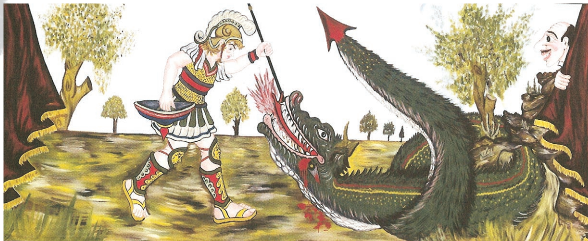
Ο Μεγαλέξανδρος και το καταραμένο φίδι. Ποδιά του Θ. Σπυρόπουλου

Ο Μεγαλέξανδρος δεν ανήκει στην παράδοση του Καραγκιόζη.