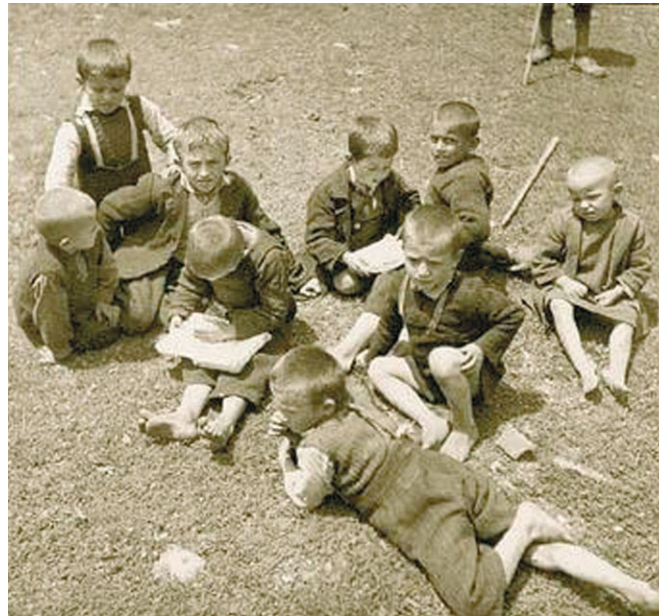
Παιδιά διαβάζουν στην ελεύθερη Ελλάδα. 1944

- Στα γλυκίσματα είμαι και εφευρέτης μάλιστα έλεγε εκείνος. Εγώ είμαι αυτός που ανακάλυψε εκείνη την ωραία χαρουπόπιτα στην